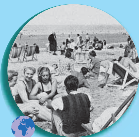
70 ème anniversaire des congés payés (1936 - 2006)

Depuis les origines de l'humanité, les hommes, grâce à leur intelligence, ont appris à utiliser les richesses de la nature afin d'améliorer leurs conditions de vie.