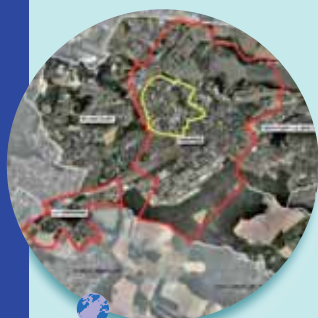
En jaune, le tracé de la ZFU de Trappes - Saint-Quentin-en-Yvelines

Sa mission : intégrer le projet dans son environnement proche, améliorer et rééquilibrer l'offre d'habitat et proposer des surfaces de bureaux et de commerces.