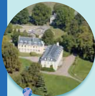
Le Mérantais (centre d'accueil)