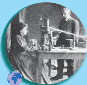
Pierre et Marie Curie inventent la radiothérapie