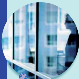
La présence des entreprises : un atout pour le territoire

Qui accepterait d'abandonner l'électricité, la machine à laver ou sa console de jeux vidéo pour se nourrir de cueillette, s'habiller de peaux de bêtes et retourner au bon vieux temps des cavernes ? Personne, même si cela était possible.