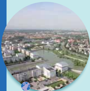
Le bassin de Villaroy

Autre avantage, à Saint-Quentin-en-Yvelines, ces bassins de retenue ont été aménagés comme des lieux de promenade, pour joindre l'utile à l'agréable.