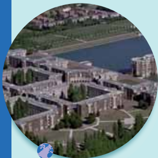
Les Arcades du lac

Dans les pays en développement, une grande partie de la population en est privée, il est essentiel de la préserver.