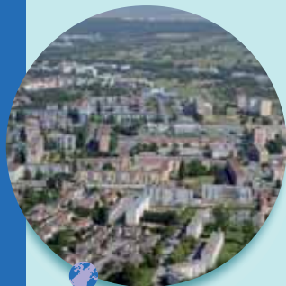
Le quartier des Merisiers