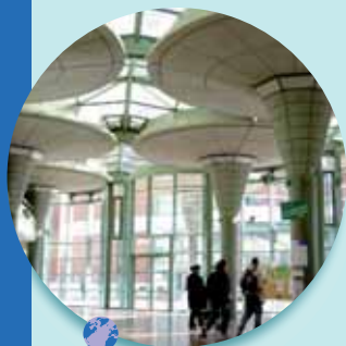
Le pôle universitaire et de recherche Versailles Saint-Quentin-en-Yvelines : un atout pour la formation

Ce développement doit bénéficier à tous et la répartition des richesses et des moyens reste un objectif prioritaire du territoire.