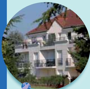
Un parc qui structure tout un quartier

L'un des derniers projets, le jardin Paul et Virginie, à Guyancourt, a débuté en 1988, lorsqu'un pépiniériste a fermé ses portes, laissant sur place un merveilleux trésor d'arbres et de plantes rares.