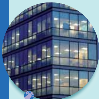
Redévelopper le tissu économique