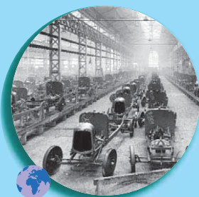
Les usines Citroën vers 1922