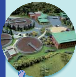
Station d'épuration à Élancourt

...L'eau de pluie rejoint tout simplement un réseau de canalisations indépendant spécialement prévu pour elle.