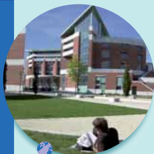
Le parc des sources de la Bièvre : garantir un environnement de qualité

Une ressource vitale, lorsque l'on sait que la taxe professionnelle (taxe payée par les entreprises) est la principale source de financement de la Communauté d'agglomération, qu'elle réinvestit dans les projets urbains, économiques et sociaux de toutes les communes de Saint-Quentin-en-Yvelines.